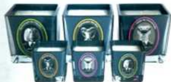
Bougies 300g : 60 heures de combustion, 62 € 75g : 15 heures de combustion, 27 €