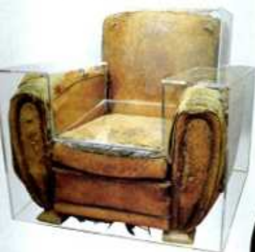
Fauteuil Plexi sur mesure prix sur demande