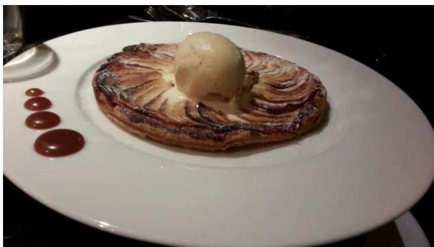
Café du théâtre

C'est donc dans une ambiance feutrée que nous sommes accueillis. Les couleurs pourpres sont au rendez-vous, une ardoise noire affiche les plats du jour, les serveurs et serveuses sont charmants et souriants. Quant au service, il se fait avec une rapidité déconcertante, sans même que vous ne puissiez-vous en rendre compte. : un personnel actif et rapide qui bizarrement se fond parfaitement dans le restaurant et renforce le côté intimiste que peut dégager l'enseigne. C'est en grande partie ce qui nous a plu sans compter le côté chic mais pas trop, brasserie mais pas trop, animé mais pas trop. Pour ce qui est du spectacle que vous offre le Café du Théâtre, vous assistez bien à un show mais pas à celui auquel vous vous attendez. Pas de comédiens ou de comédiennes sur les planches pour vous amuser, mais bel et bien des plats aussi bons les uns que les autres pour divertir vos papilles gustatives. La carte est vaste, nous sommes tentés de tout prendre et les prix sont plus que raisonnables. Pour une formule entrée, plat, dessert vous pouvez vous en sortir facilement avec un billet de 50 euros et l'assurance d'épater vos copains ou de charmer votre "date" du moment.