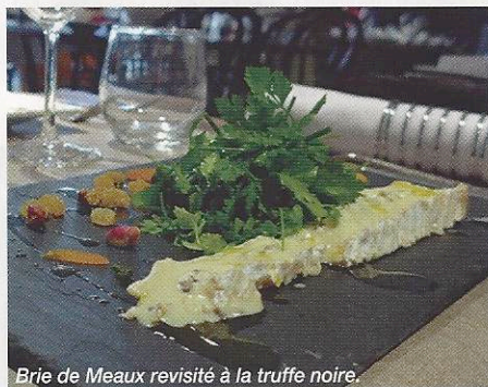
Brie de Meaux revisité à la truffe noire.