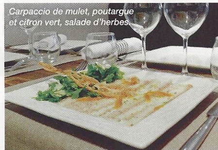
Carpaccio de mullet, poutargue et citron vert, salade d'herbes.