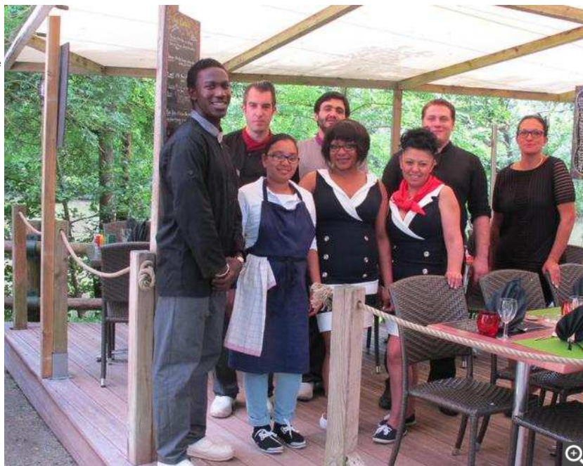
Une partie de l'équipe de salariés à bord de L'Île Jouteau depuis début mai.