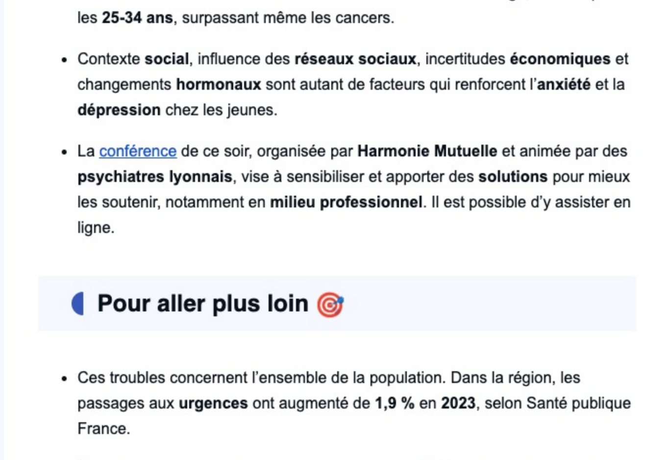
Le suicide est la 2e cause de mortalité chez les 15-24 ans, et la 1e chez les 25-34 ans. En cas de besoin, contactez le 3114.

Une rencontre sur l'état psychique des jeunes se tient ce mardi à 18h à l'École Rockefeller (Lyon 8e).